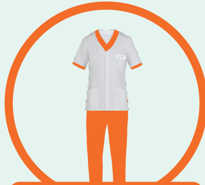
OPERATORE SOCIO SANITARIO - OSS