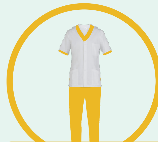
OPERATORE DI SUPPORTO