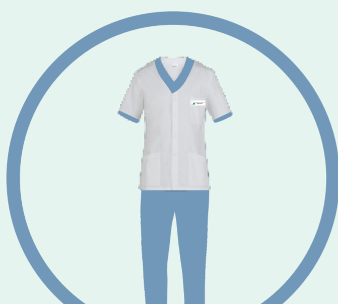
MEDICO IN FORMAZIONE SPECIALISTICA