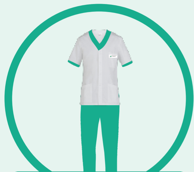
INFERMIERE INFERMIERE PEDIATRICO