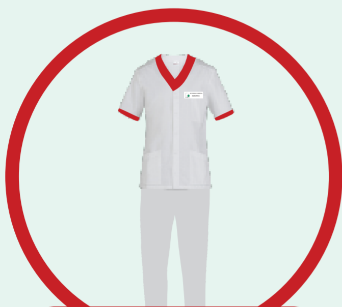
FISIOTERAPISTA LOGOPEDISTA ORTOTTISTA