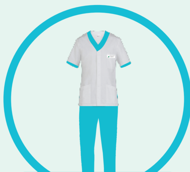
TECNICO SANITARIO DI RADIOLOGIA MEDICA TECNICO AUDIOMETRISTA TECNICO SANITARIO LABORATORIO BIOMEDICO TECNICO AUDIOPROTESISTA IGIENISTA DENTALE TECNICO DI NEUROFISIOPATOLOGIA