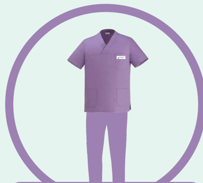
PERSONALE DI ANESTESIA E RIANIMAZIONE TERAPIA INTENSIVA NEONATALE